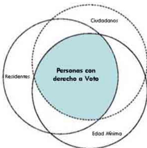
Cuadro 1 - Sólo individuos de cierta edad que son ciudadanos residentes tiene el derecho a votar

Muchos países como Canadá y Namibia limitan el derecho a votar sólo a sus ciudadanos.