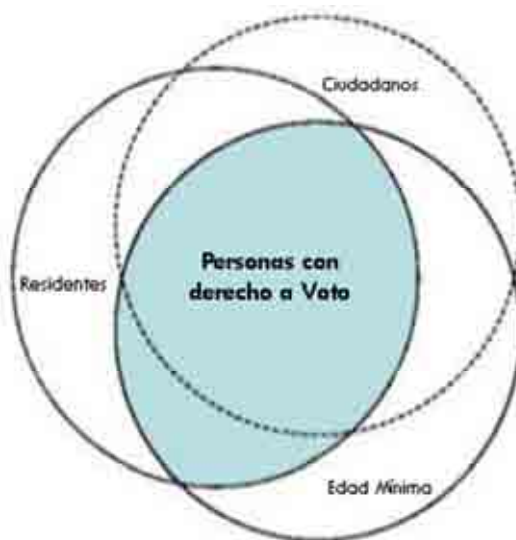
Cuadro 2 - Sólo individuos de cierta edad que son ciudadanos o residentes no ciudadanos tienen el derecho al voto

Hay quienes consideran inapropiado que no ciudadanos tengan el derecho a votar, ya que en el fondo su lealtad está dirigida hacia otro país. De manera práctica, en algunos países, residentes no ciudadanos podrían no tener documentación que acredite que han sido residentes en el país durante el número de años requeridos para ser elegibles para votar. Estos temas son de particular relevancia en países que tienen grandes poblaciones inmigrantes o donde muchas personas tienen residencia demostrable pero pocos tienen ciudadanía demostrable.