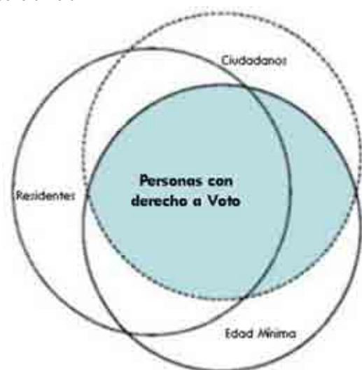
Cuadro 3 - Sólo individuos de cierta edad que son ciudadanos residentes o ciudadanos no residentes tienen el derecho a votar

Sin embargo, extender el derecho a votar a los ciudadanos que viven fuera del país puede requerir la creación de procedimientos administrativos elaborados para que puedan emitir su voto el día de las elecciones. Este tema puede ser de particular dificultad para aquellos países que cuentan con muchos refugiados que viven fuera de sus fronteras. Un tema sensible que debe confrontarse es la designación de un distrito electoral dentro del país al cual se deberían asignar sus votos. Esta decisión podría acarrear un impacto sustancial en aquellas elecciones que están basadas en distritos electorales en lugar de aquellas basadas en una representación nacional proporcional.